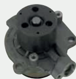
A255V / A255