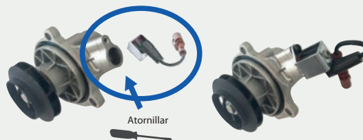
A255 / A255E versión Mecánica

Desatornille el switch eléctrico de la bomba de agua de origen (OE) y atorníllelo en la carcasa específica tal y como se muestra en las imágenes.