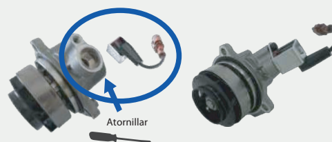
A255V versión Variable

Desatornille el switch eléctrico de la bomba de agua de origen (OE) y atorníllelo en la carcasa específica tal y como se muestra en las imágenes.